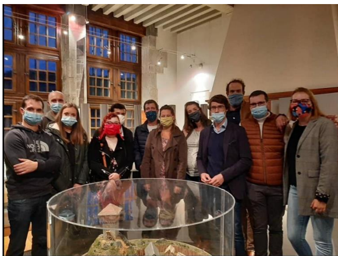
Sortie extérieure au musée « La Maison du patrimoine médiéval mosan » le 27.10.2020.