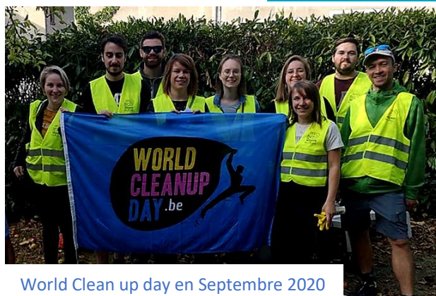
World Clean up day en Septembre 2020