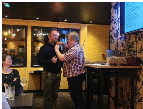
Pinsage au district de Luxembourg