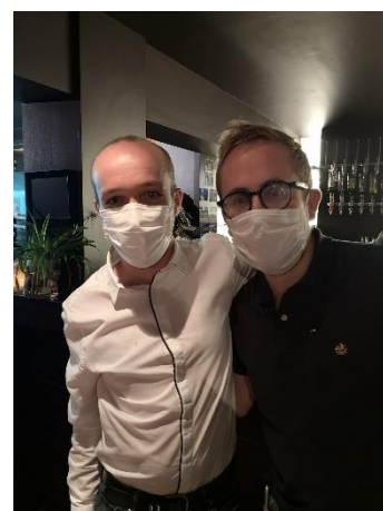
Pinsage à JCI Arlon