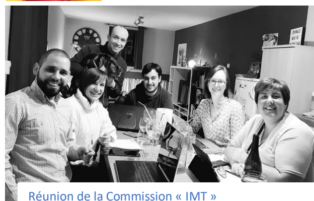
Réunion de la Commission « IMT »