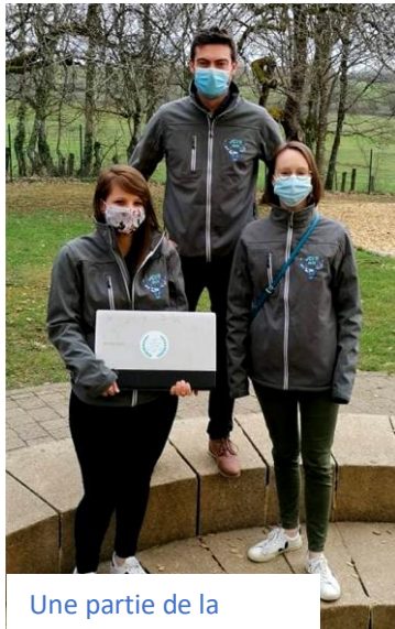
Une partie de la Commission « Les Ordis de la réussite »