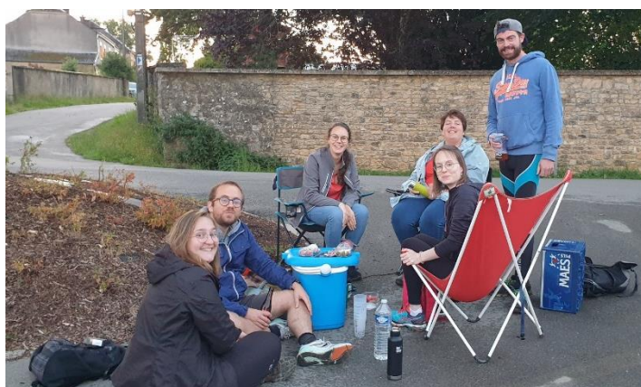
Team building – marches Arlonaises