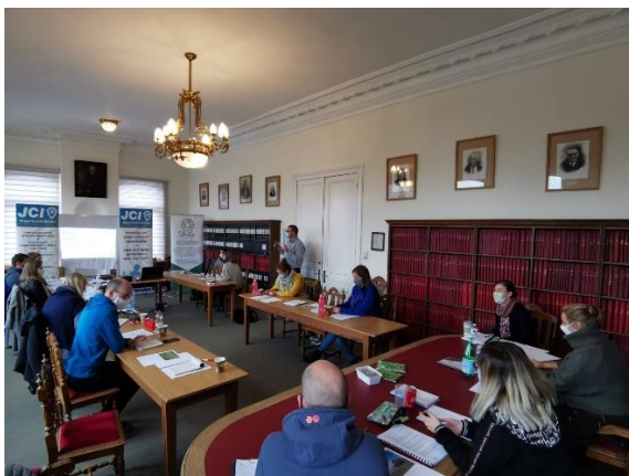
Formation « Comment contrer les manipulateurs » 17 octobre 2020 – Henri-Chapelle (JCI PdH)