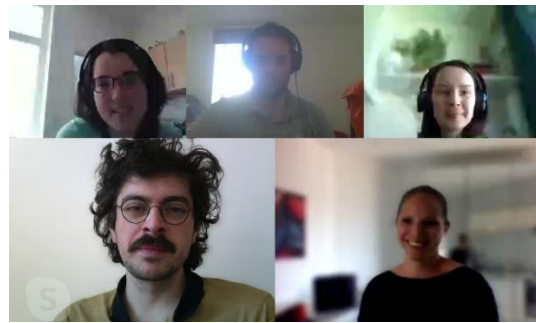
Formation « Réunion efficace » 11 avril 2020 – Online (JCI Bruxelles)