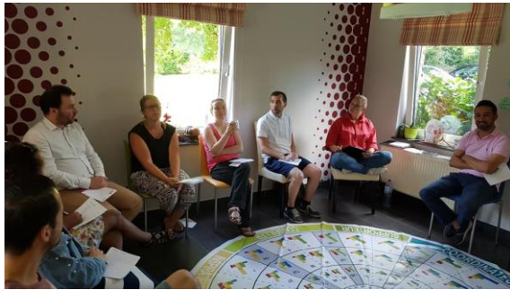
Formation « Je me connais, donc je te reconnais » avec "Insights Discovery" 27 juin 2020 – Namur (JCI Namur)