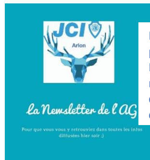
Exemple de post Facebook récapitulatif que Marie crée