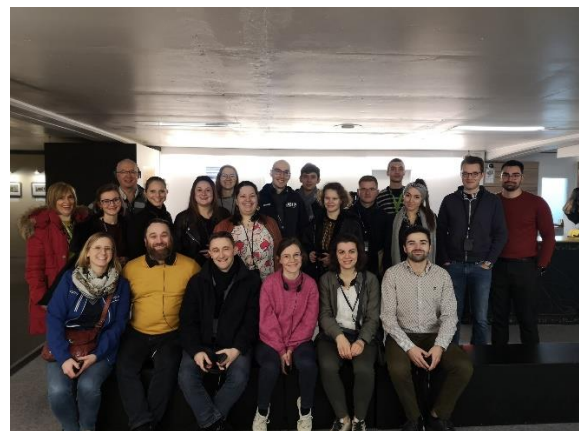
AG de District + Visite Expo Toutankhamon 29 février 2020 – Liège (District de Liège)