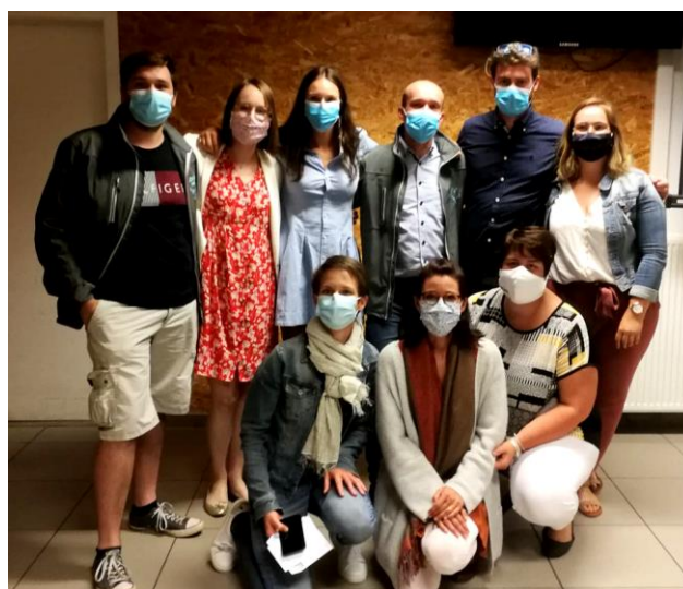
Election du Conseil d'Administration 2020-2021