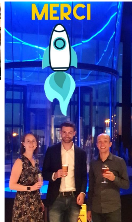
Commission « Horizon 2021 » lors de la soirée de clôture en juillet 2020