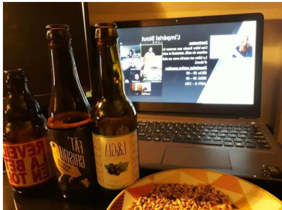
Atelier zythologie en ligne