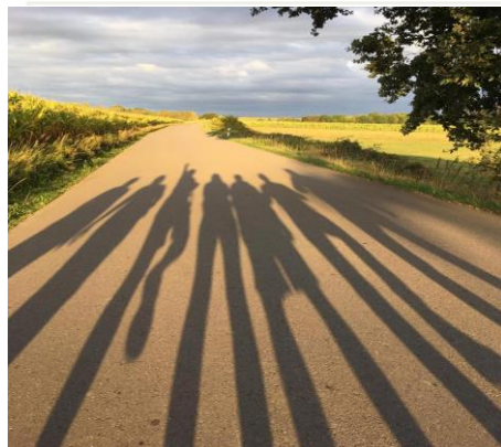
Relais pour la vie