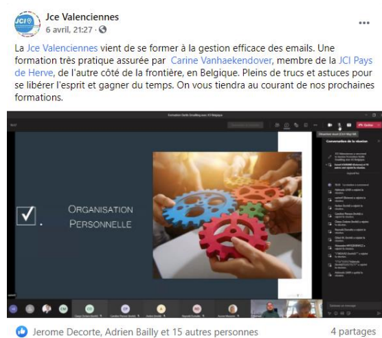
Formation « Gestion des e-mails » 6 avril 2021 – Online (JCE Valenciennes)