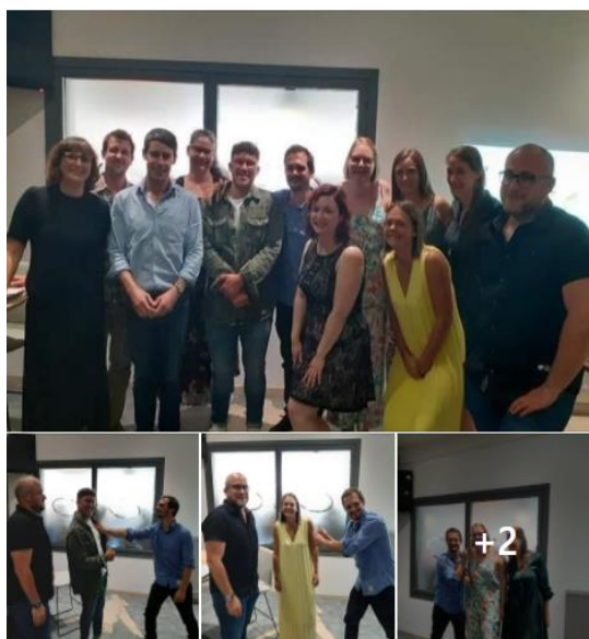
Passation de pouvoir et intronisation de 3 nouveaux membres dans notre QG le 21.06.2020