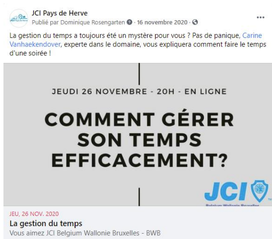
Formation « Gestion du temps » 26 novembre 2020 – Online (JCI BWB)