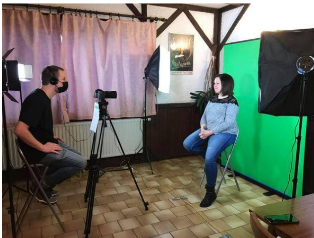
Silence on tourne nos capsules vidéos !